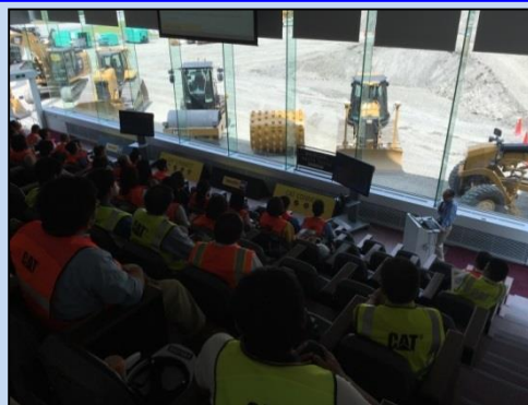
ICT建機のデモンストレーション